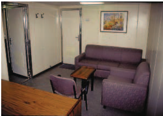
Der Wohnraum der Eignerkabine