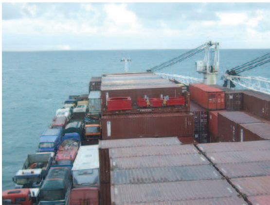
Sicht von der Kommandobrücke