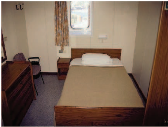
Blick in den Schlafrum der Eignerkabine