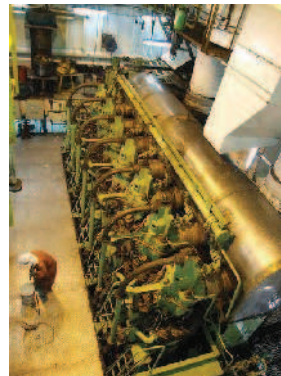
Blick in den Maschinenraum